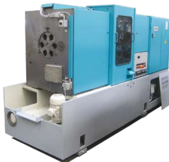
État de la machine à la suite d'un rétrofit complet

Hotline: +49 (0)711 3191-600 service@index-werke.de