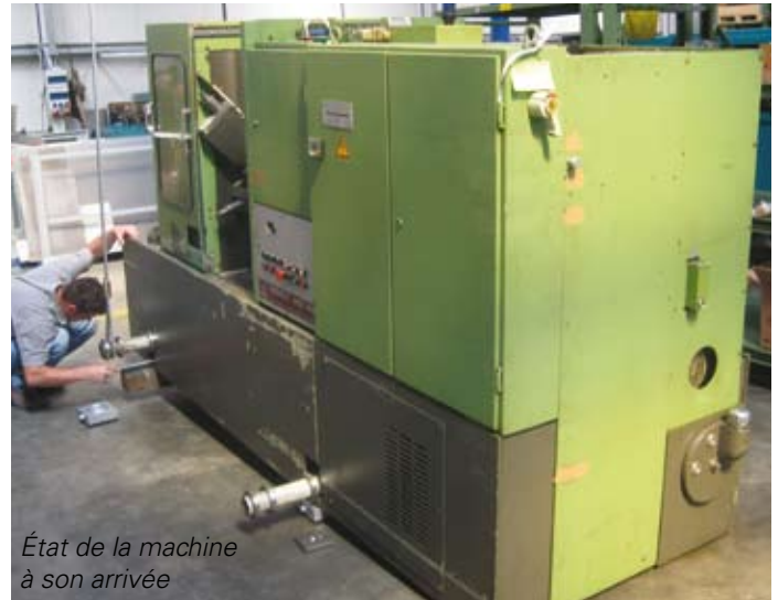
État de la machine à son arrivée